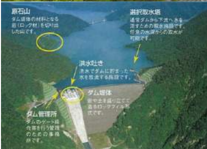
徳山ダム堰体全景