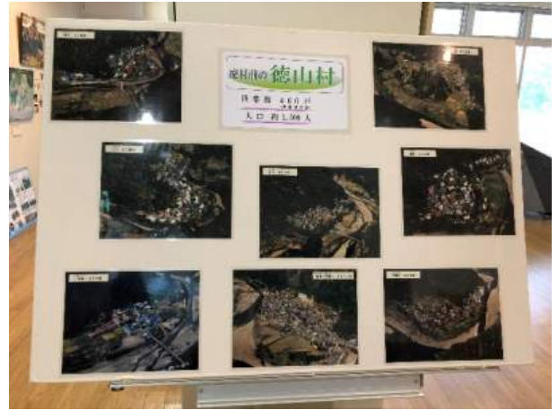
徳山会館展示室（徳山湖全体模型・8つの村の消滅）