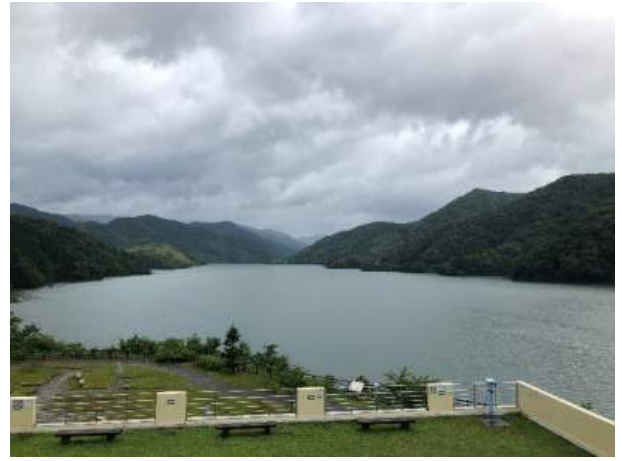
徳山会館からのダム湖